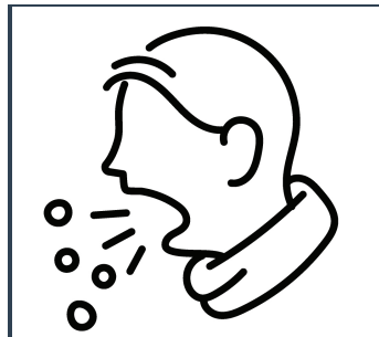
Decirnos si esta enfermo