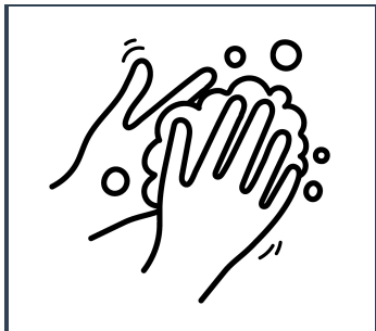
Lavarse sus manos