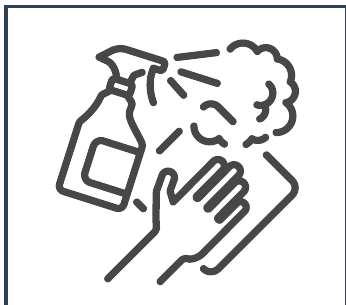
Limpiando y desinfectando