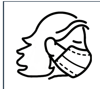
Usar una mascarilla