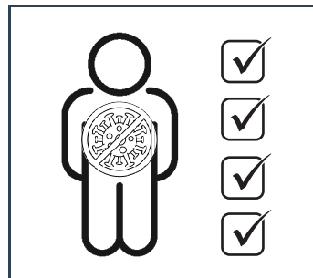
Evaluación de síntomas