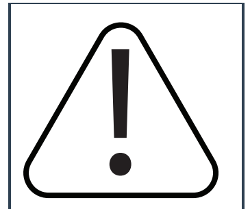
Decirnos si corre mayor riesgo