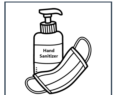
Mascarillas y desinfectante de manos